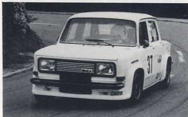
Norbert Gapp driftet seinen Simca Rallye 3 durch die Kurven beim Oberjoch-Bergrennen