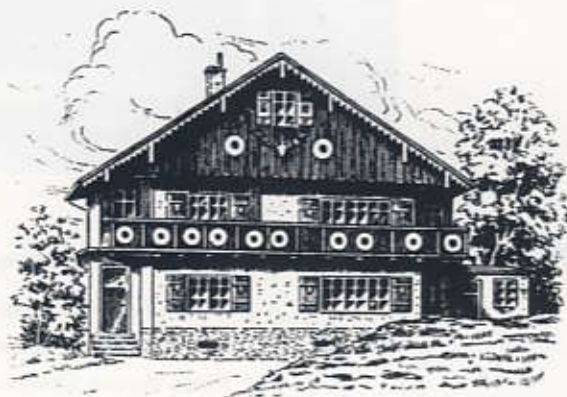
Schützenhaus am Schönbühl

8990 Lindau (B) · Kemptener Straße, am Schönbühl · Tel. 65 60