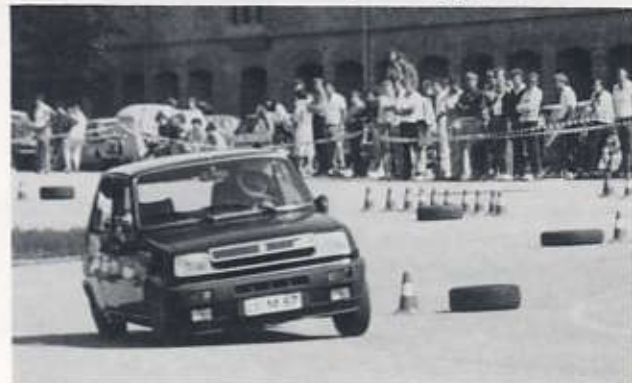
Charlotte Frick auf Renault A5 beim Automobil-Slalom Sonthofen