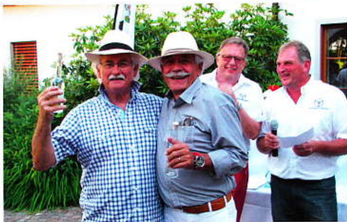
Zielwasser für die Besten einer Zeitprüfung

Gundi Krügers Lindauer Straße 85 88138 Weißenberg Tel. 08389 / 9201-0 Fax 08389 / 9201-99