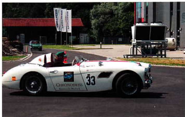
zu sehr sportlich.