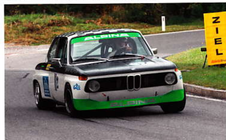
Karl-Heinz Schlachter mit dem BMW 2002 Gruppe H