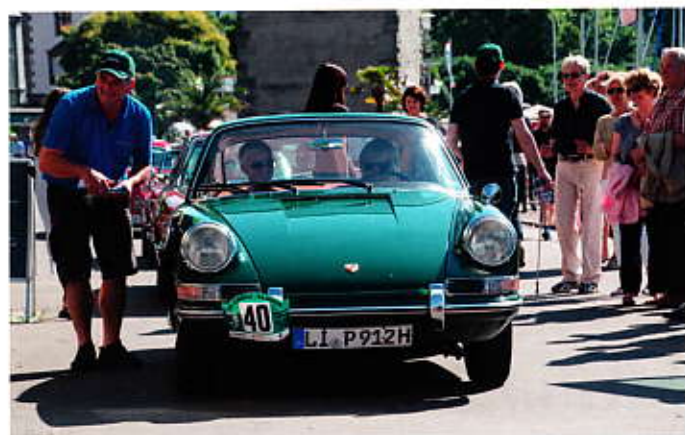
Thomas Schäffler Porsche 912 Bj. 1965