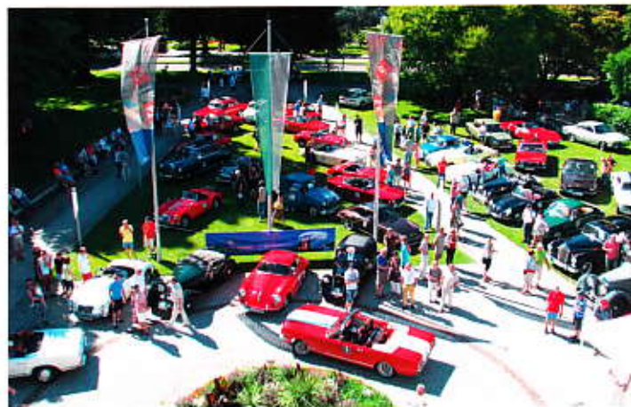
An der Bayerischen Spielbank