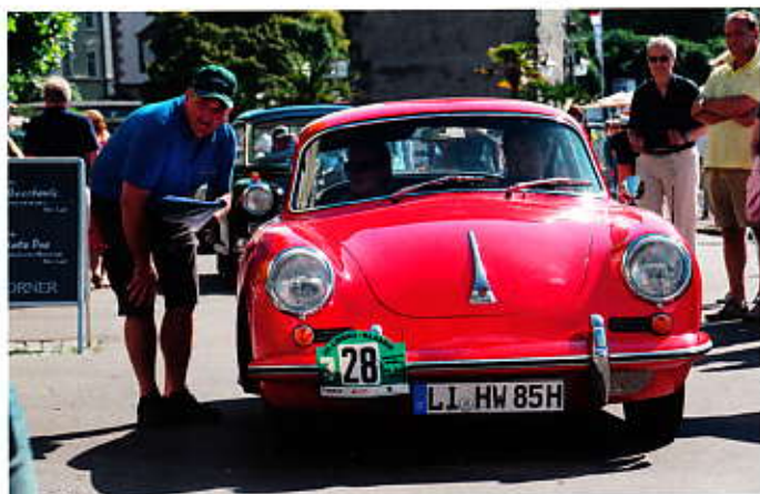
Martin Spiegel Porsche 356 Super Bj. 1961