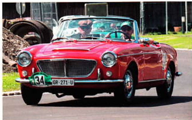
Reto Hosig Fiat Spider Bj. 1963