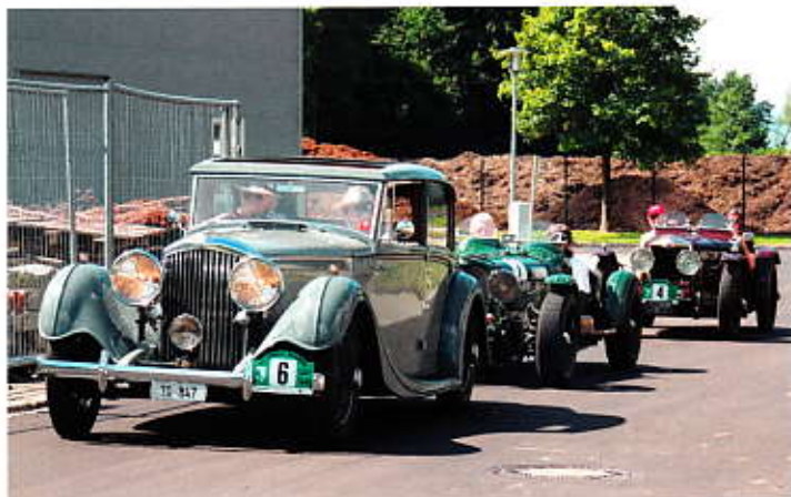
Oldtimer von elegant über sportlich