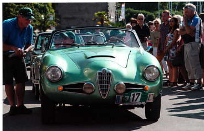
Alfa Romeo 1900 Super Sprint Bj. 1954