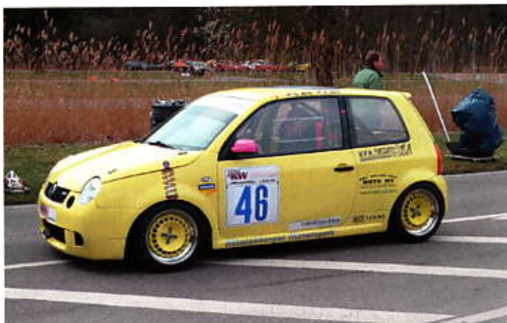
Florian Arlt mit dem 200 PS Lupo