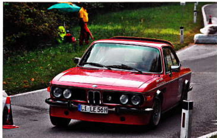
Flotte „Oldies“ Mercedes 220 SE und BMW 3,0 CSI