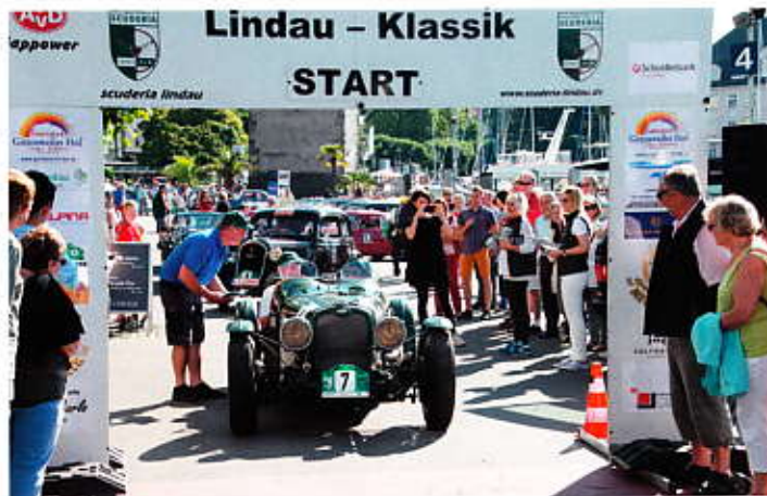
Am Start Triumph Spezial G Bj.1936

Natürlich wartete die eine oder andere Zeitnahme und Durchfahrtskontrolle auf die Teilnehmer. Die letzte Zeitprü-