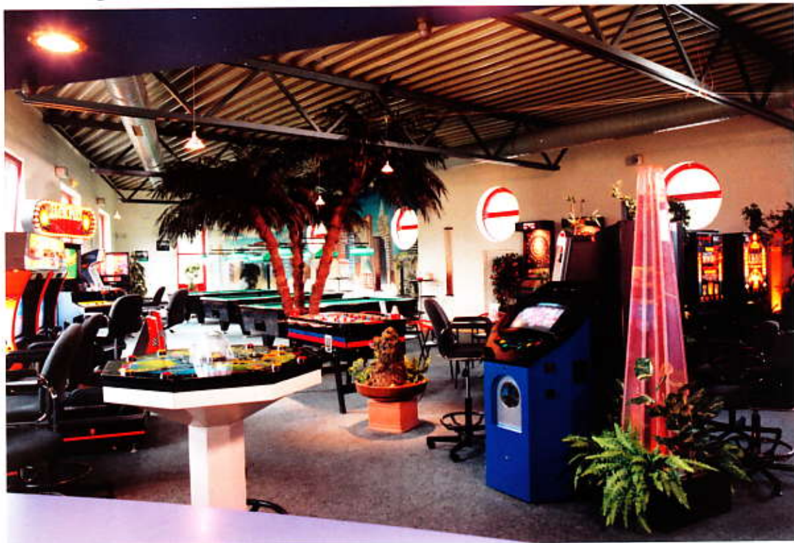
Billard-Café „Monte Carlo“, Lindau, Robert-Bosch-Str. 40, 1. Etage Aral-Tankstelle am Autobahnzubringer

Wer nicht länger auf sein Glück warten will, sollte ihm etwas entgegenkommen.