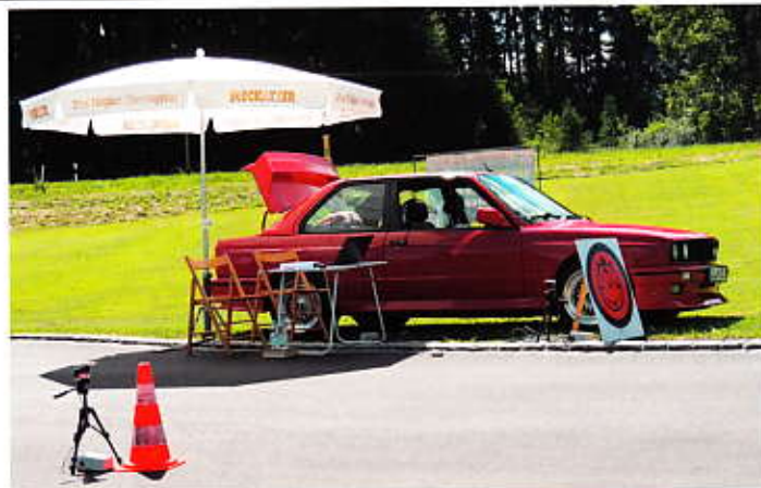
Streckenposten stiehlt im M3