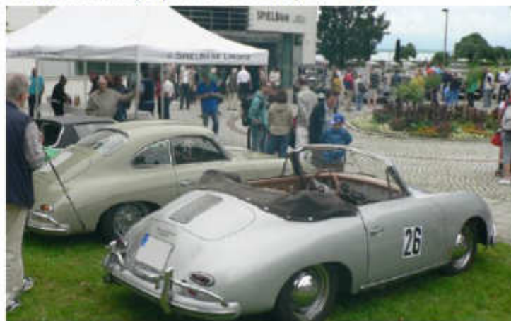
Großes Zuschauerinteresse an der Bayerischen Spielbank