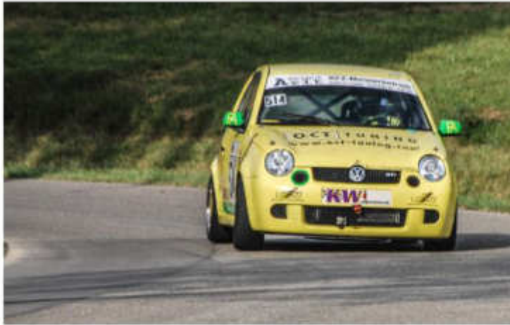
Florian Arlt - Lupo Gruppe H ca. 165 kW (225 PS)