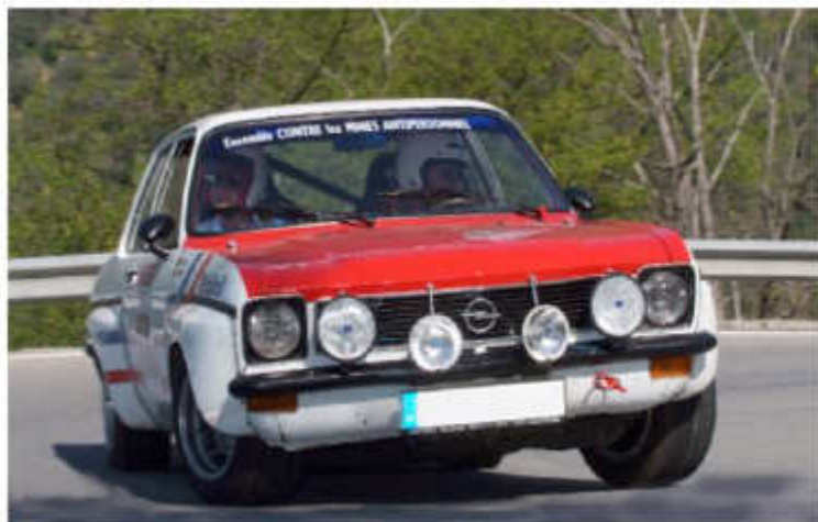
Wolfgang Ströhm – Klassensieger bei der Elba-Rallye 2012

Der Erfolg wiederholt sich auch bei der 17. Lindau-Klassik, die inzwischen zu den besten Rallyes im 3 Ländereck gehört.