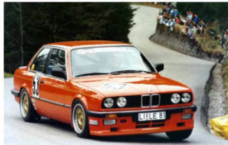
1986 Ernst Laufer - BMW 325i am Wallberg