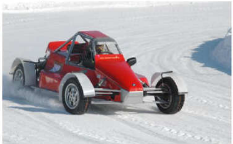
2003 „Jimmy“ Grübel – Eigenbau mit BMW M3 Motor