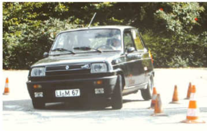
1983 Charlotte Kinnbach – Renault Alpine R5