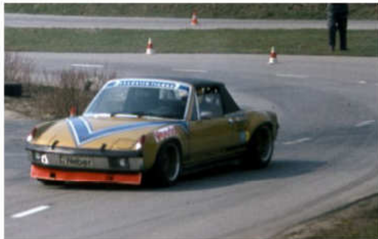
1976 Dieter Weber – Porsche 914 RSR