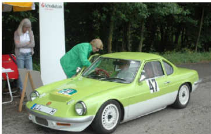
Selten aus England Ginetta G15 Bj. 1969