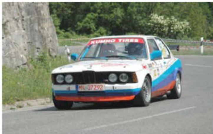
2014 Ilka Zeller mit dem BMW 320 am Stübinger Berg