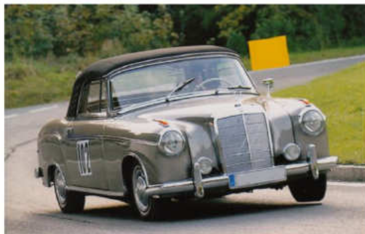
Manfred Biesinger –Klassensieger 2016 mit MB 220 am Eichenberg