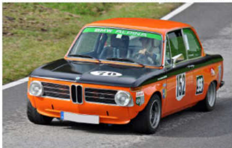
2014 Karl-Heinz Schlachter – BMW 2002 Alpina am Eichenberg