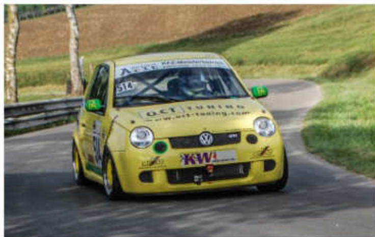
VW Lupo 1600 ccm ca. 225 PS