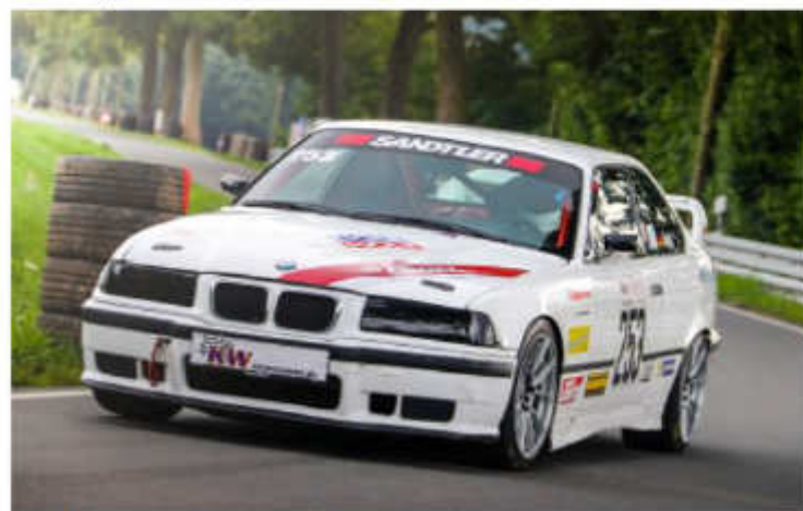
BMW M3 3000 ccm ca. 340 PS