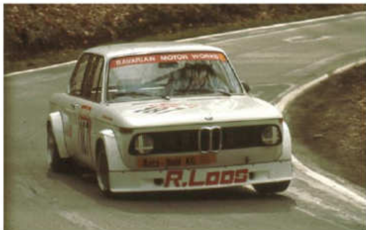
1976 Reinhard Loos – BMW 1502 Gr. 2