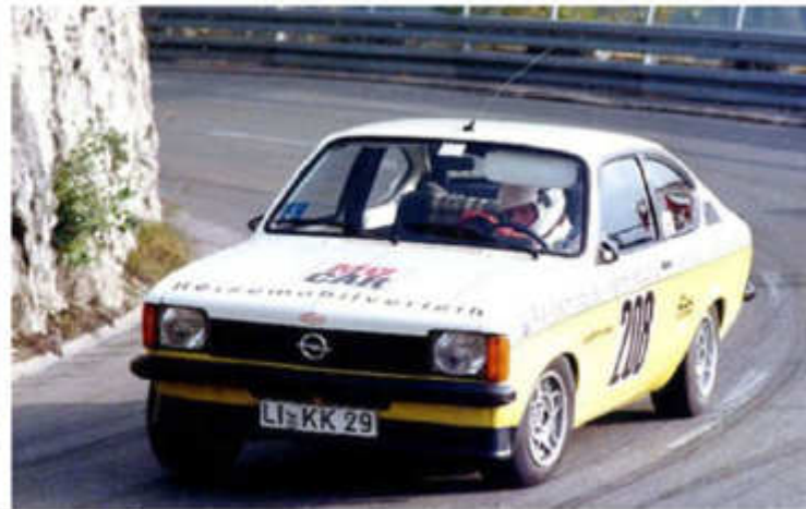
1984 Thomas Schäffler - Kadett G2 am Oberjoch