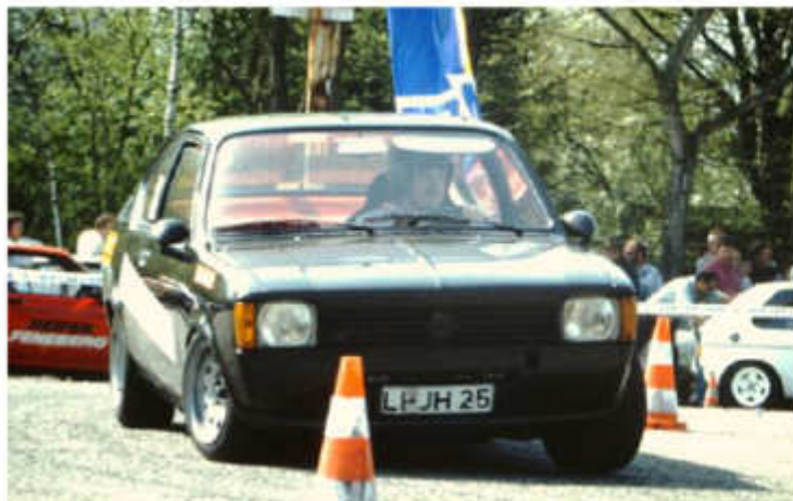
1992 Norbert Pfau - auf dem „Hornung-Kadett“ in Lindau