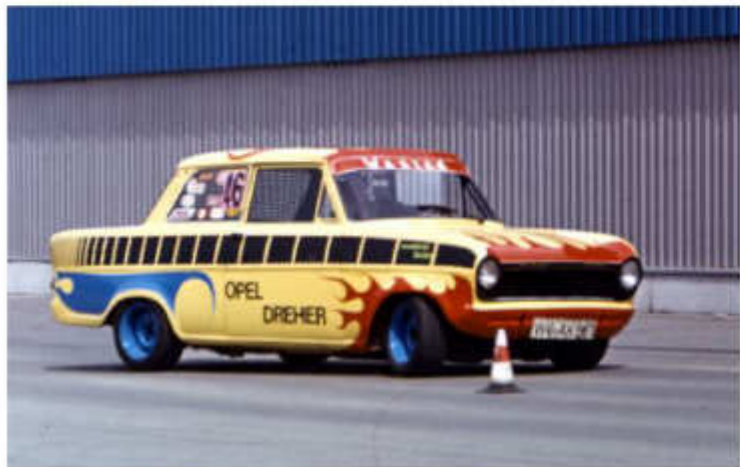
1973 Der legendäre „Dreher - Kadett“