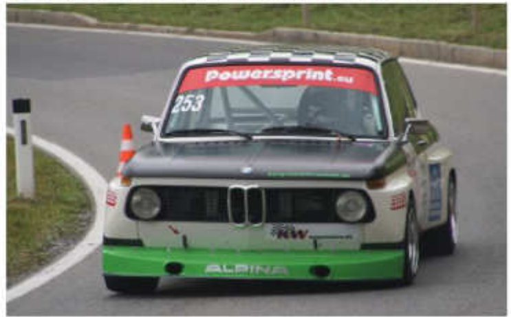
Karl-Heinz Schlachter - BMW 2002 Gruppe H ca. 188 kW (255 PS)