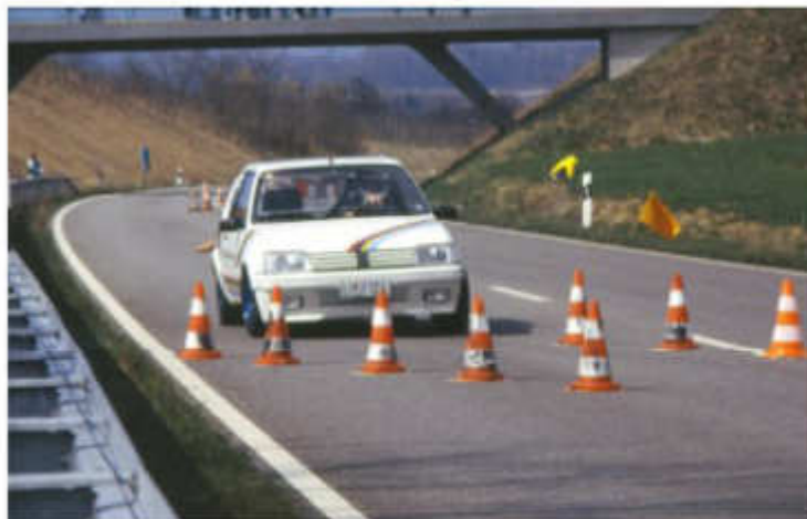
1992 Jochen Sutterlitte - Peugeot Rallye