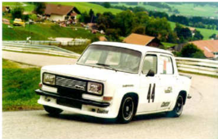
1982 Norbert Gapp - Simca Rallye 3 am Auerberg