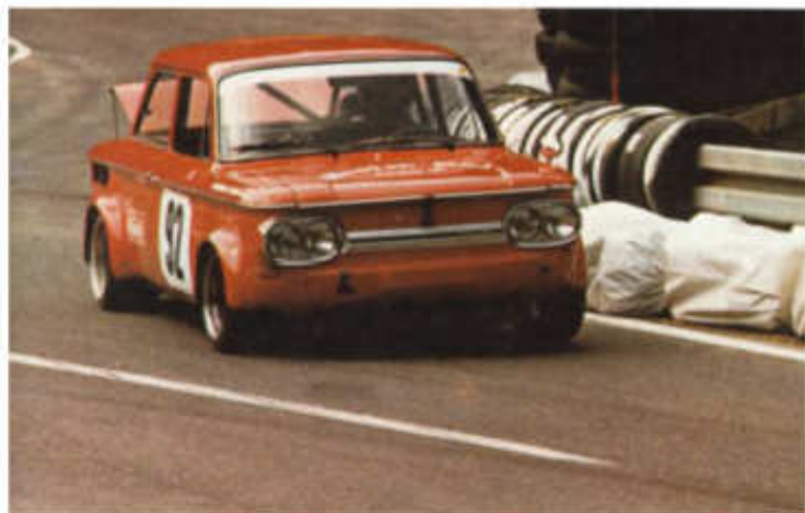
1977 Roland Grübel – NSU 1300 TT