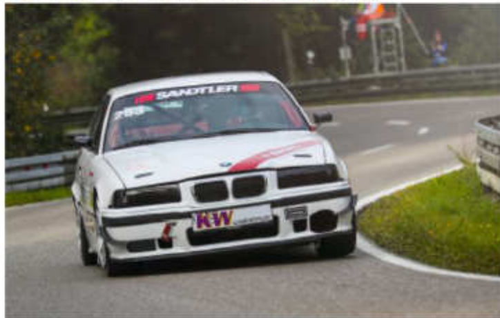
Marcel Gapp - BMW M3 Gruppe H ca. 252 kW (340 PS)